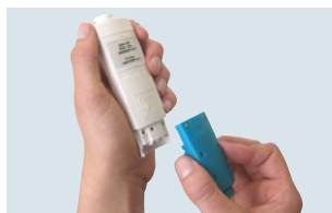
Cambio sencillo de sonda en los testo 206-pH1/-pH2/-pH3