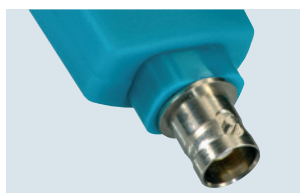
testo 206-pH3: sonda pH3 con conector BNC