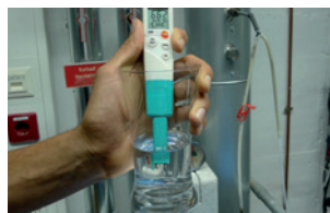
Ideal para comprobación de agua de calefacción conforme a VDI 2035.