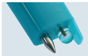
testo 206-pH1: sonda pH1 para líquidos